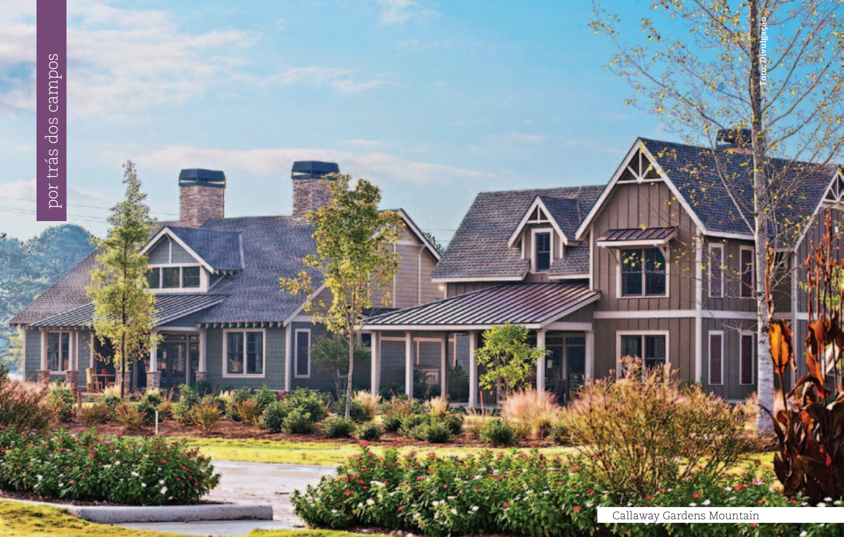
Callaway Gardens Mountain